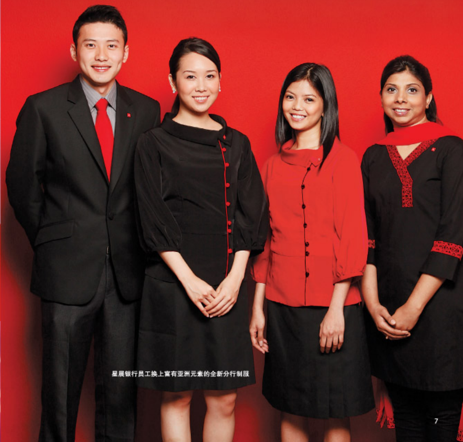
星展银行员工换上富有亚洲元素的全新分行制服

2010年获欧万利（Euromoney）、亚洲金融（FinanceAsia）及全球金融（GlobalFinance）颁发“新加坡最杰出银行”奖。